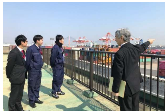
プロパー社員の採用と人材育成で更なる飛躍を目指します (新入社員の研修)