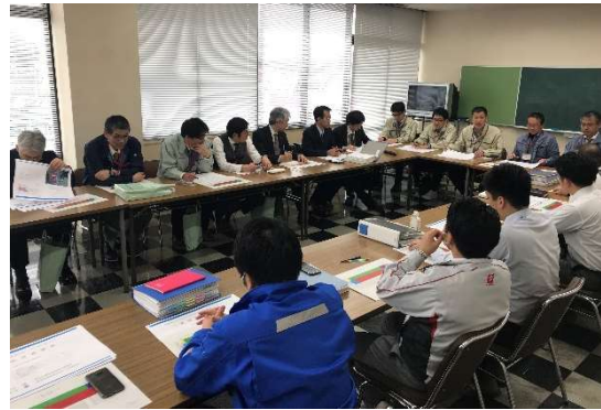
サービス向上のため、利用者との調整は日々の大切な業務 (利用者との調整会議)