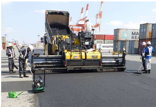
使いやすい施設の整備・補修に努めています (ヤード舗装の補修)